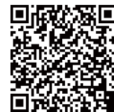
同码重复 扫描间隔时间 1S