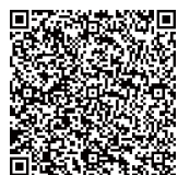
允许识读所有条码