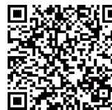
同码重复 扫描间隔时间 0.5S