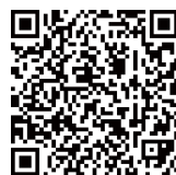
只识读全部二维码