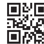
允许识读所有条码