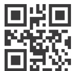
添加回车换行结束符