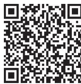
添加回车结束符（默认）