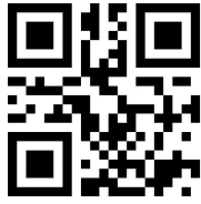
**Code32 前缀 A 输出