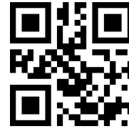
Code32 前缀 A 不输出