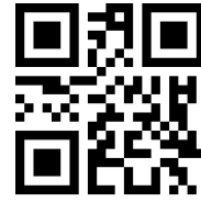
扩展式 RSS AI 不带括号输出